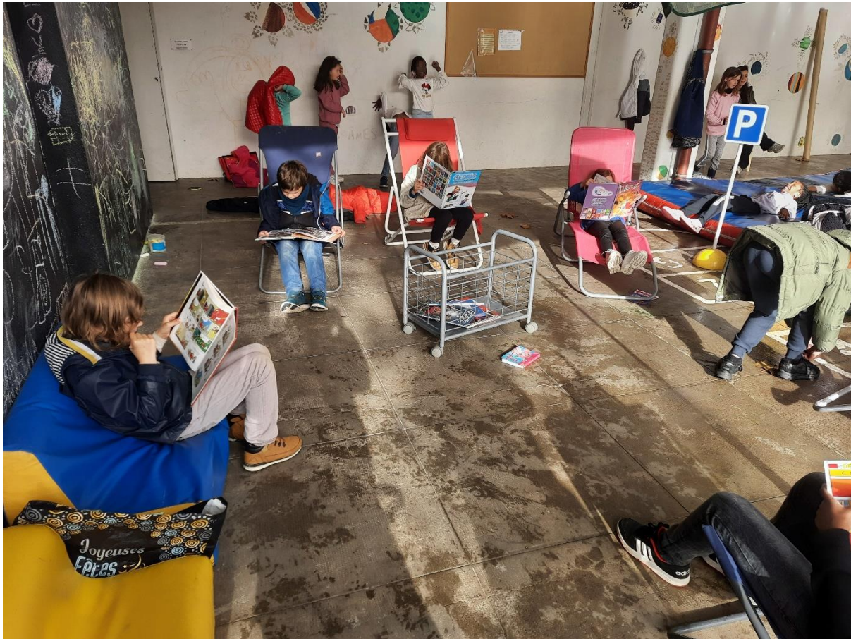
Semaine d'expérimentation d'une cour nature, égalitaire et inclusive sur Pauline Roland élémentaire

partenaires de l'inclusion (Handisup, chargée d'inclusion, parent d'élève membre de la commission accessibilité...) ont donné lieu à des préconisations du cabinet, notamment sur l'axe inclusion.