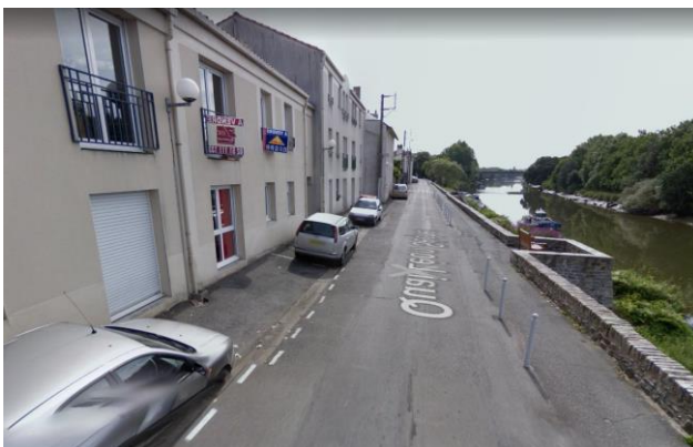
Quai Léon Sécher avant et après