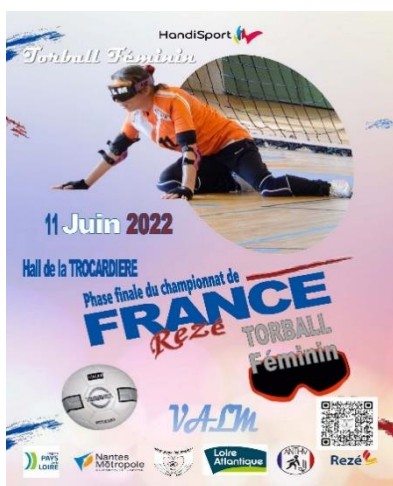
Photo : Organisation de la phase finale du championnat de France de Torball Féminin à Rezé

Equipes finalistes : Nice, Laval, Toulouse, Grenoble et Rezé