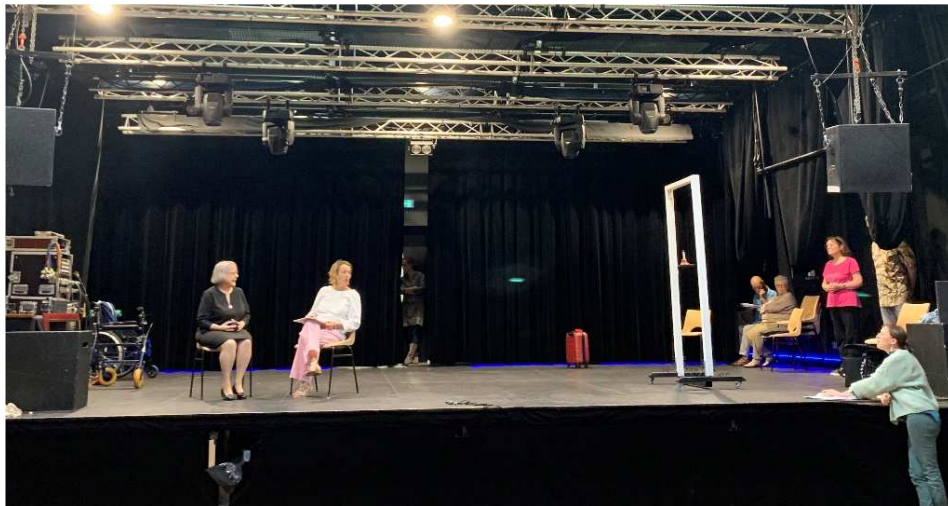
Le groupe d'habitantes et habitants répètent la pièce de théâtre.

Le Forum Habitat Séniors est financé à hauteur d'environ 20 000 € dont :