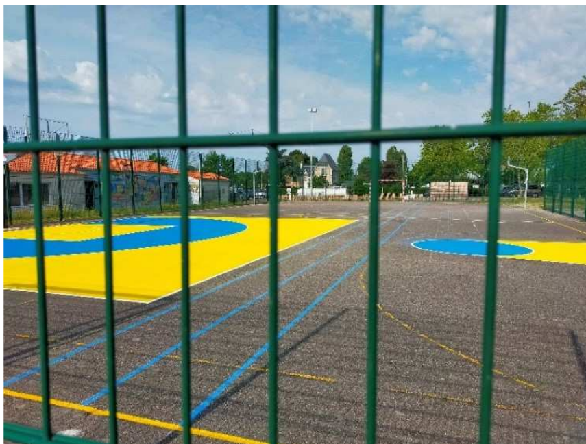
Le plateau sportif de Ragon

« Toutes ces actions viennent s'ajouter à celles déjà réalisées en 2022 comme la création de deux parcours d'orientation dans le stade Léo-Lagrange et à la Jaguère ainsi que la rénovation du terrain de pétanque place Odette-Robert », ajoute l' élu. « Cette feuille de route n'est pas gravée dans le marbre. Elle peut évoluer en fonction des opportunités ou des aléas ».